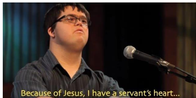
« Dankzij Jezus, heb ik het hart van een dienaar... »

Ook hier gingen mensen voor haar genezing bidden. Ze is niet genezen, en blijft verlamd tot onder haar oksels. Steeds aangewezen op hulp. Maar hierdoor heeft ze zoveel tijd kunnen investeren in haar relatie met God en in de opbouw van een heel grote organisatie die over de hele wereld bekend staat als Joni and Friends en hulp biedt aan de gehandicapten in de wereld. De boeken die zij over haar lijden schrijft, zijn boeken over bemoediging, over getuige van Gods genade en zoveel meer.