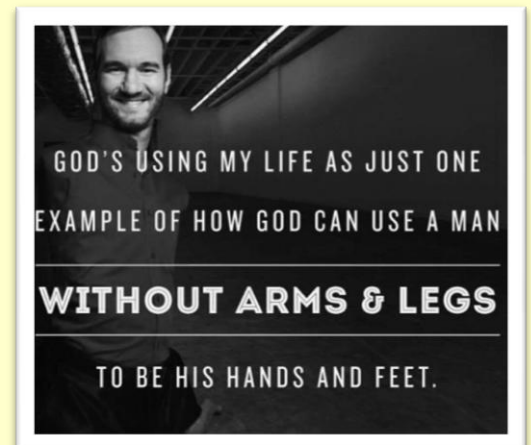
Nick Vujicic – geboren zonder ledematen. Door zijn handicap gebruikt God hem om wereldwijd het Evangelie te brengen.

Door dat deze gehandicapte mensen zo dikwijls gekwetst zijn door opmerkingen van valide personen hebben ze een vermogen ontwikkeld welke hen in staat stelt precies in te schatten welke mensen ze voor zich hebben. En vooral, hun domheid indachtig, het niet aan te rekenen.