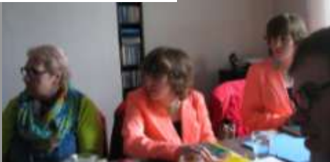
BC Noord Limburg

Intussen gaat de tijd verder. Zelf zit je met een boel vragen en moet je veel nadenken over hoe het leven nu verder moet. Bij mij was het dan ook nog de vraag van wat er met mij aan de hand was, want de dokters vonden geen goeie diagnose. Ik kan je verzekeren dat dit alles niet meewerkt aan je zelfvertrouwen. Mensen beginnen ook aan je te twijfelen. Ze zeggen het niet want zo open zijn onze broeders en zusters niet. Ze zullen je niet zeggen dat ze denken dat je veinst, of dat je een profiteur bent, of dat het tussen je ogen zit. Zou je niet eens denken aan pastorale counseling? Misschien is er iets in je leven dat uitgeklaard moet worden? Niet alleen heb je met het wereldse wantrouwen van dokters en gewone mensen en familieleden te maken maar mensen uit de gemeente denken op net dezelfde wijze. Want een antwoord is er niet! Alleen een hoop vragen! Ik begon aan mezelf te twijfelen. Het was zo erg dat ik bij mijn huisarts ging smeken of ik toch niet een beetje 'gek' aan het worden was.